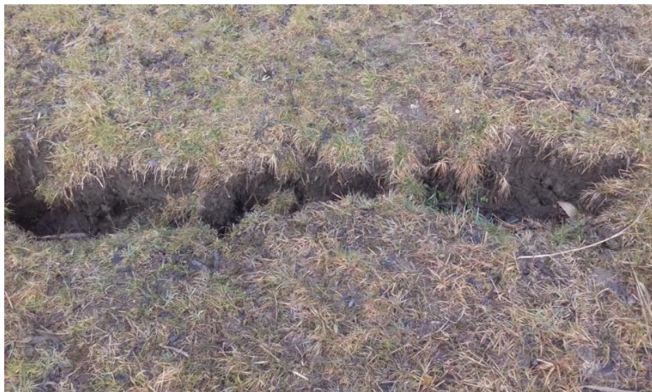
Beszakadt hódjárat a Zagyva bp. 62+700km szelvényében 2017. decemberében