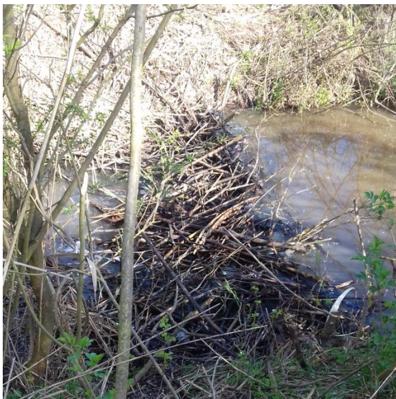
Jászsági szivárgó - Pély