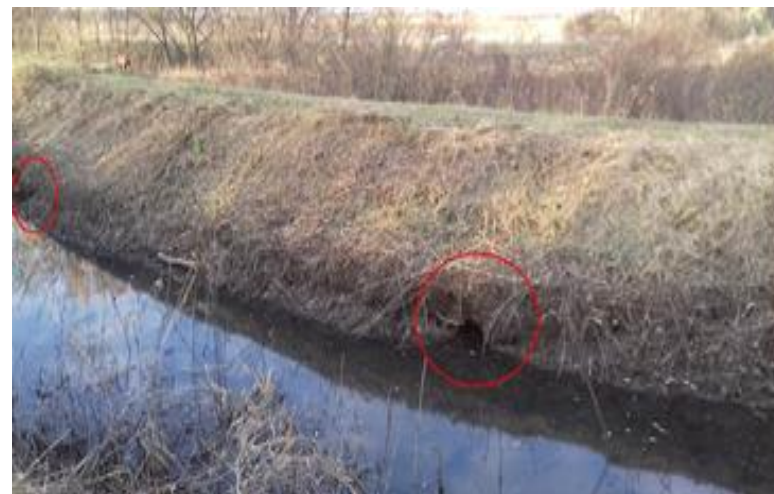
J-III-1 öntözőfőcsatorna téli üzemi vízszintjénél felbukkanó járatok