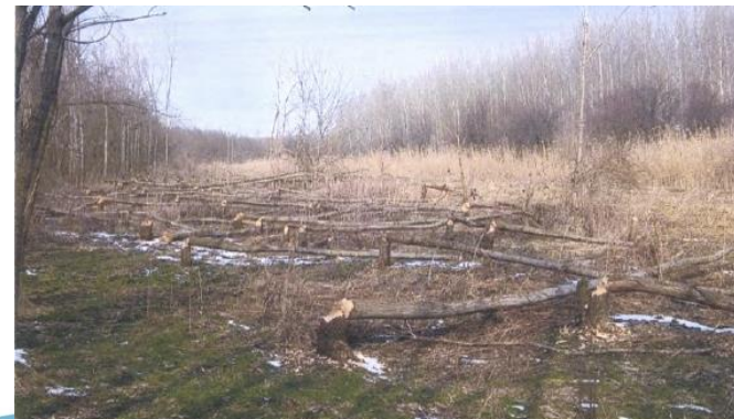
Abádszalóki kártétel 2018. év elején